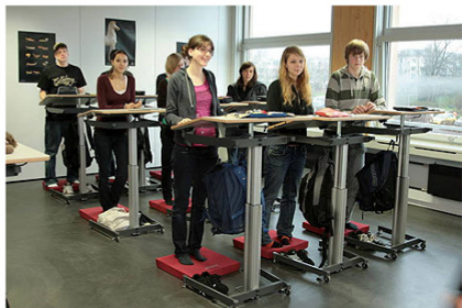
Erste Schulklasse ohne Stühle in der Schweiz eingeweiht kybun ag